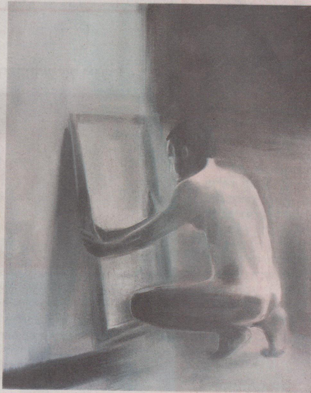
יוסף קריספל, "Man in Front of A Mirror", 2010. גלריה נגא בתל אביב